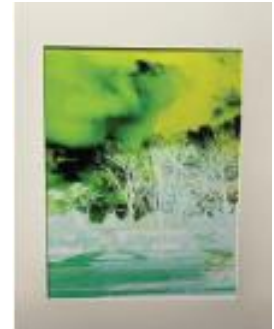
Cielo y árboles alterados, Ken R

Esta exposición de arte se exhibirá durante dos años en los sitios de servicio de salud mental de la comunidad en todo Michigan. Todas las obras de arte estarán disponibles para la venta en estos eventos y en las conferencias de las CMHA.